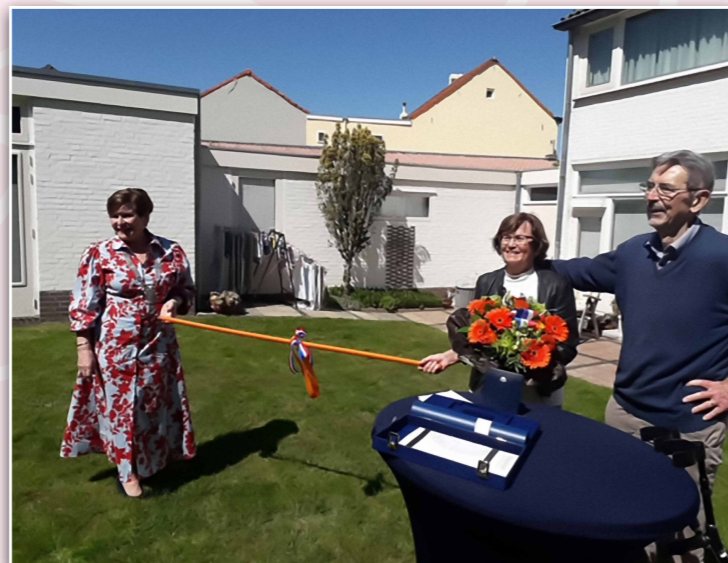
Tiny kreeg in 2021 een lintje voor haar inzet voor de maatschappij

“Ik ben zestien jaar lang de steun en toeverlaat voor mijn man geweest.”