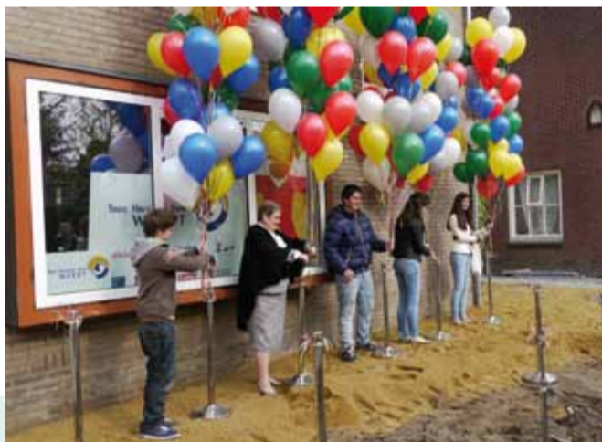
Fotografie: Bert van Maaren (met dank aan Toon Hermans Huis Weert)

De Boezemtocht is helemaal afgerond. Het laatste restant van het door ZijActief afdelingen bijeen gesprokkelde bedrag is op een goede plek terechtgekomen: het Toon Hermans Huis (THH) in Weert. Deze vestiging van het THH werd op 16 april na een ingrijpende verbouwing 'virtueel' heropend met een symposium, waar ruim tweehonderd deelnemers op afkwamen.