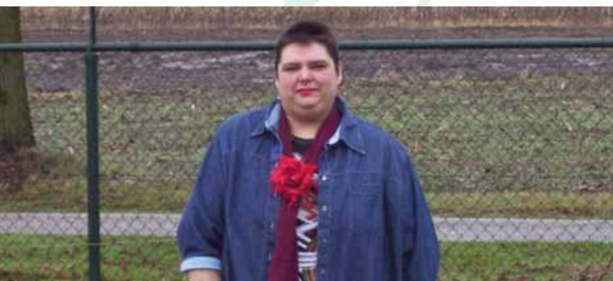
Het gezicht achter de mysterieuze naam Pimpernoot

De periode van 16 tot en met 26 maart 2011 staat dit jaar geheel in het teken van de Week van ZijActief! Vanwege de carnaval moeten we een weekje langer wachten voor het zover is, maar een leuke bijkomstigheid is dat de Week van ZijActief nu samenvalt met de Boekenweek. En die vormt een bron van inspiratie!